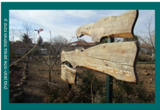
גן ברכת האילנות במושב ארזי-התשן בגולן

המחשבה בכל צעד ושעל בהליך בנייה על רצונו יתברך, "ליחזא שמא דקודשא בריך-הוא" - היא למעשה המימוש של מה שקראנו בפרשה: שבוני המשכן כיוונו בכל צעד שעל בבנייתו על "כאשר ציווה ה'".