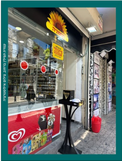
עמדת תפילין ברחוב צילום אילוסטריציה

סיפור מצמרר על קשר תפילין « קשר של-קיימא